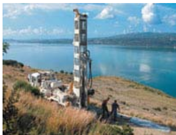
Φωτογραφία από τη γεώτρηση βάρδους 122 μ., που πραγματοποιήθηκε από την ομάδα του Μπιτλστόουν στην Κεφαλονιά